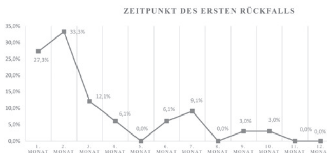
Abbildung 3: Zeitpunkt des ersten Rückfalls (n=33, nur Rückfällige)

Die Abbildung 3 zeigt bei den rückfälligen Rehabilitanden den Zeitpunkt des ersten Rückfalls. Bei 33 bekannten Rückfällen (rückfällige Katamneseantworter und abstinent nach Rückfall lebende Katamneseantworter) liegen Angaben zum Rückfallzeitpunkt vor. 72,7% aller Rückfälle mit Angaben zum Rückfallzeitpunkt ereignen sich innerhalb des ersten Quartals nach der Entlassung, davon 27,3% bereits im ersten Monat, 33,3% im zweiten Monat und 12,1% in Monat drei nach Entlassung. Ein halbes Jahr nach Entlassung haben sich schon 84,9% der ersten Rückfälle ereignet.